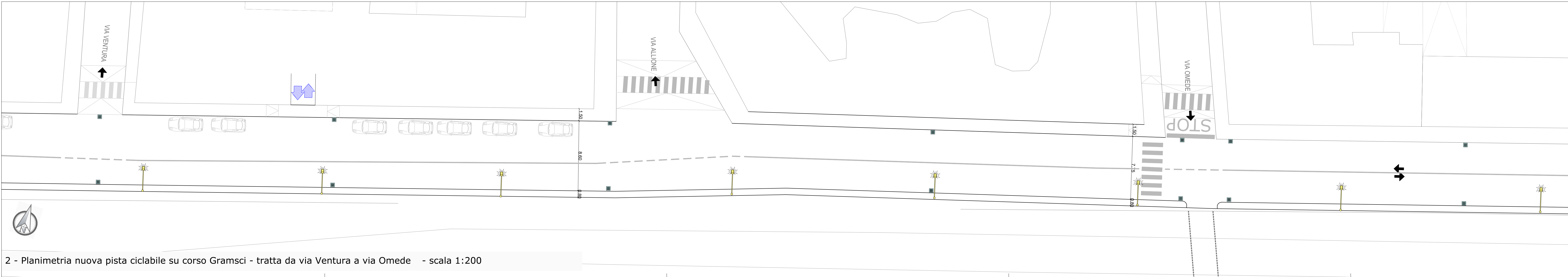
2 - Planimetria nuova pista ciclabile su corso Gramsci - tratta da via Ventura a via Omede - scala 1:200